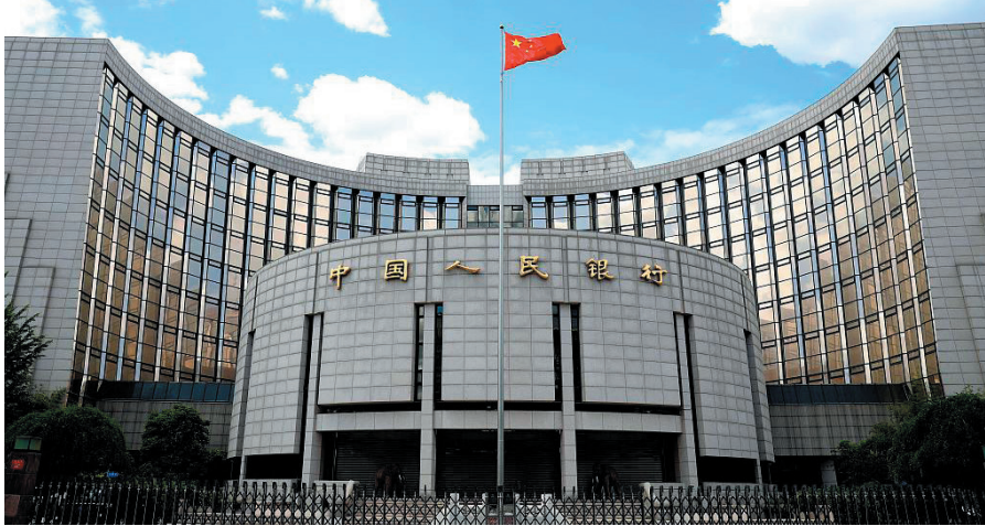
(Banca Populară Chineză, Beijing, China)

UN PACHET DE POLITICI ECONOMICE DE STABILIZARE AJUTĂ ECONOMIA CHINEZĂ SĂ DEPĂȘEASCĂ DIFICULTĂȚILE